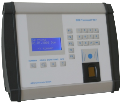
FT07 ALU mit Transponder und Fingerprint