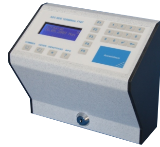
FT07 Basic und Standard